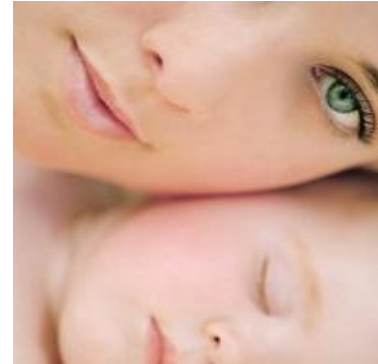
Seguro de Vida